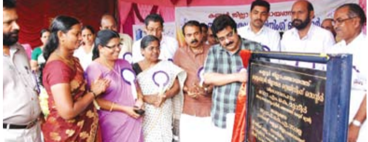
കണ്ണൂർ ജില്ലയിലെ കുറുമാത്തൂരിൽ കുടുംബശ്രീ ജില്ലാമിഷന്റെയും ജില്ലാ പഞ്ചായത്തിന്റെയും സംയുക്തസംഘമായ പരിശീലന കേന്ദ്രത്തിന്റെ ശിലാസ്ഥാപനം പഞ്ചായത്ത് സാമൂഹ്യനീതി മന്ത്രി ഡോ.എം.കെ.മുനീർ നിർവഹിക്കുന്നു

കുടുംബശ്രീ കണ്ണൂർ ജില്ലാമിഷന്റെയും ജില്ലാ പഞ്ചായത്തിന്റെയും സംയുക്ത സംഘമായ പരിശീലന കേന്ദ്രത്തിന്റെ ശിലാസ്ഥാപനം പഞ്ചായത്ത് സാമൂഹ്യനീതി മന്ത്രി ഡോ. എം.കെ. മുനീർ നിർവഹിച്ചു. ലോകം ഉറ്റുനോക്കുന്ന നിലയിലേക്ക് കുടുംബശ്രീ വളർന്നിട്ടുണ്ടെന്നും വിമാനങ്ങളിൽ വിതരണം ചെയ്യുന്ന ഭക്ഷണ സാധനങ്ങളിൽ കുടുംബശ്രീ ഉല്പന്നങ്ങൾ ഉൾപ്പെടുത്തു